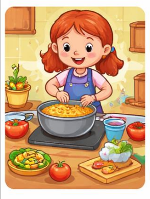
AJUDAR A CUINAR