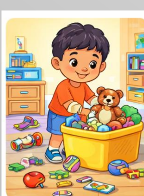
RECOLLIR LES JOGUINES