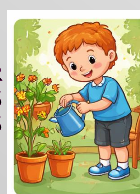
REGAR LES PLANTES