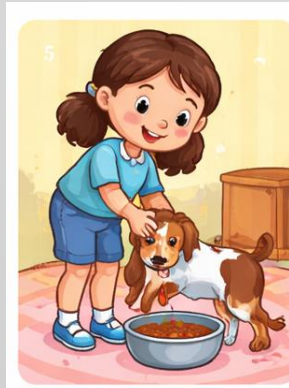
CUIDAR LA MASCOTA