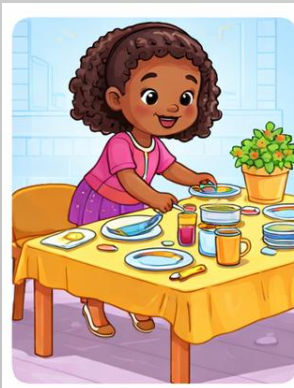
PARAR I DESPARAR TAULA