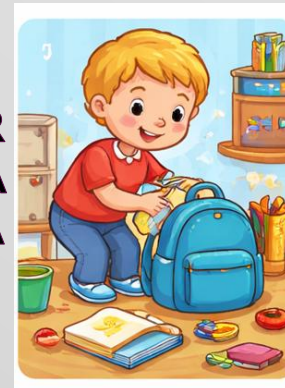
PREPARAR LA MOTXILLA