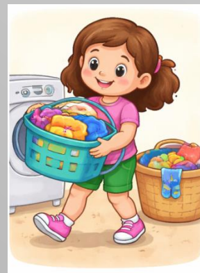
RECOLLIR LA ROBA BRUTA