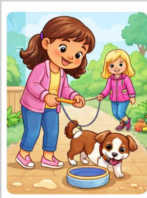
PASSEJAR LA MASCOTA